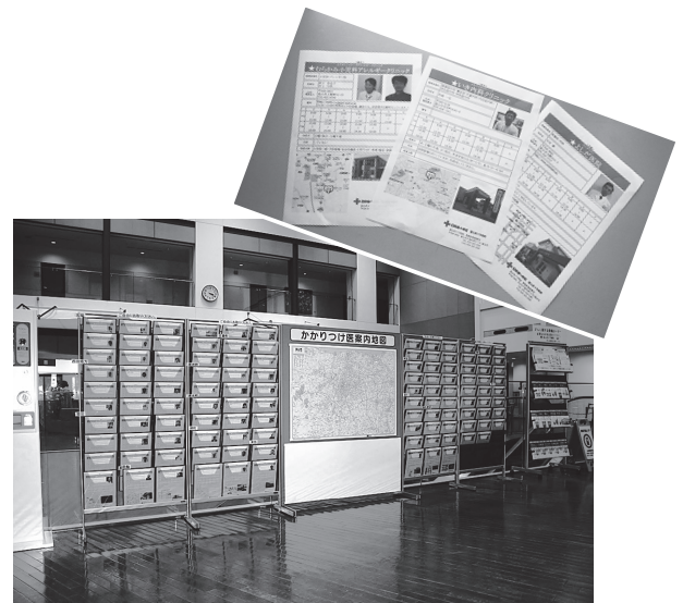
当院では8月12日から、かかりつけ医紹介パンフレット提示をはじめました。

なお、かかりつけ医についてご相談を希望される方は、院内担当医、担当看護師、相談窓口をご利用ください。