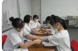
バイタルサイン測定