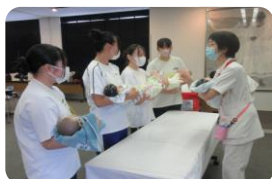
赤ちゃんの抱っこ体験