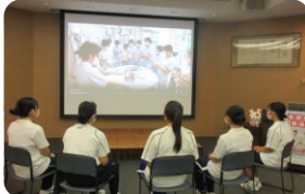
キラリ看護の仕事動画視聴