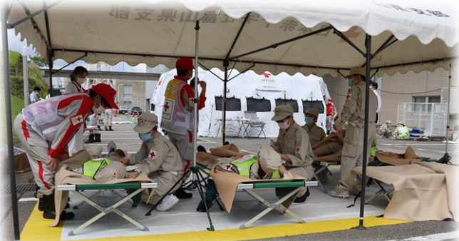
優先度第2位の方が運ばれるエリア(黄)