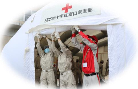
エアーテント設営