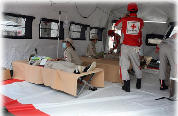
優先度の高い症例の方が運ばれるエリア(赤)