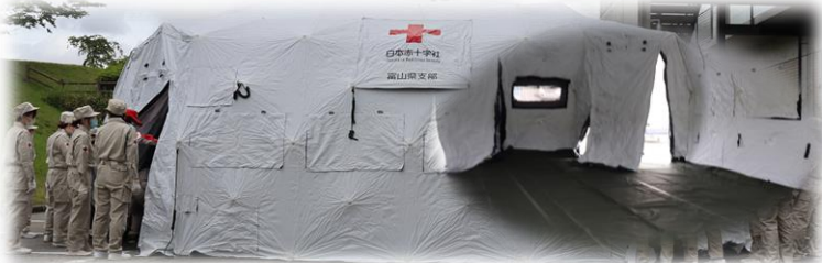
救護所や救護班員の宿舎として使用します