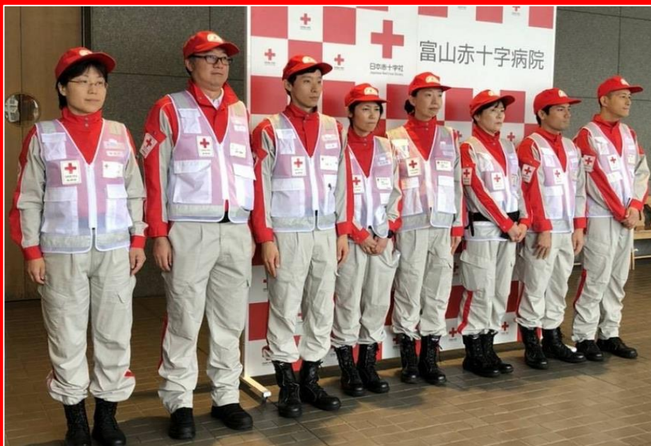
令和元年台風第19号災害(長野県)に向かう救護班の様子