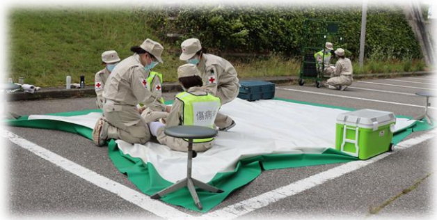
医師以外でも手当てができる方が運ばれるエリア(緑)