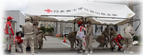
パワーパイプテント組み立て