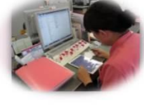
記録はタブレットで・・・