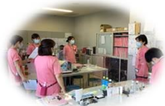
朝のミーティング風景