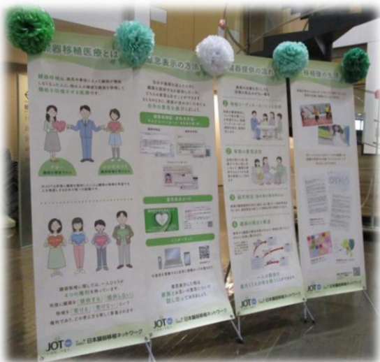
昨年の当院での活動の様子

もしものときに、ご家族が悩んだり迷ったりしないよう、今この機会に、「いのち」について話合ってみませんか？