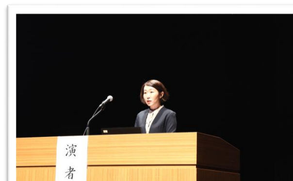
「乳がんと上手につきあうために」 乳がん看護認定看護師 東看護師