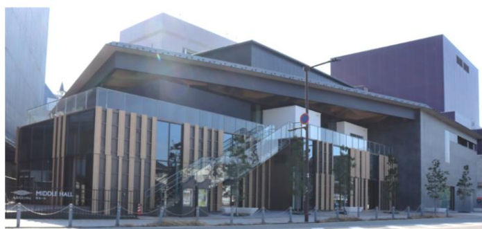
会場のオーバード・ホール(中ホール)

講演では、当院外科医師から「乳がんについて学ぼう」と題して、乳がんについて”なんとなくは知っている”という方にも症状や治療法等を今一度わかりやすく説明しました。次に当院乳がん看護認定看護師から、「乳がんと上手につきあうために」を認定看護師の立場からお話しました。最後に乳がん術後のリハビリについて、当院作業療法士から術後の生活ために乳がん術後リハビリの作業療法についてわかりやすく皆さまにお話しました。