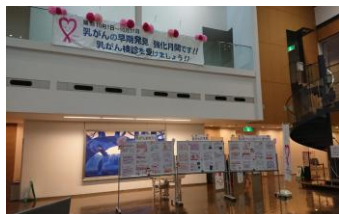
乳がん月間ポスター掲示の様子