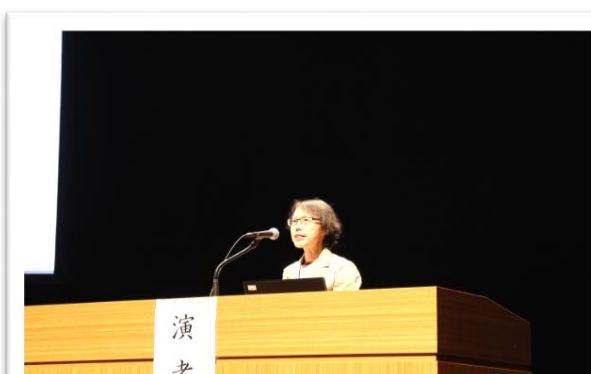
「乳がん術後のリハビリについて」 リハビリテーション科課長補佐 館作業療法士